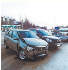
Информация и фото УГИБДД РК по г. Ухта

Авария произошла 6 февраля в 14.31. Водитель Honda CR-V на регулируемом перекрестке пр. Ленина и пр. Космонавтов при повороте налево на «зеленый» не уступил дорогу Renault Logan, который также двигался на разрешающий сигнал. В результате пострадала пассажирка Renault – женщина 1947 г. р., сидевшая рядом с водителем. От госпитализации отказалась.